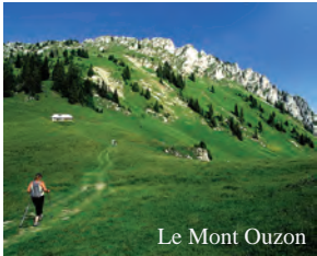
Le Mont Ouzon

Le ruisseau de la Tire traverse une forêt de feuillus assez rare, composée de bouleaux et d'hêtres.