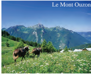
Le Mont Ouzon

la Vallée d'Aulps, le Mont-Blanc, le lac Léman, le Mont Ouzon, le barrage du Jotty.