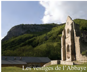
Les vestiges de l'Abbaye

Le Domaine de découverte de la Vallée d'Aulps, comprenant notamment les vestiges majestueux de l'Abbaye Notre Dame d'Aulps, un jardin de plantes médicinales et un potager médiéval, s'étend sur 3 hectares et se visite toute l'année.